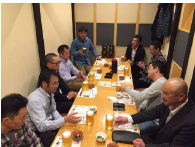
会員相互の情報交換及び研修