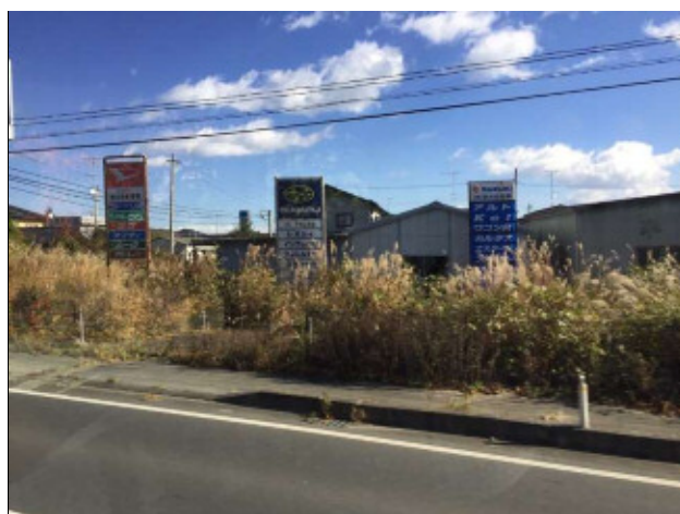
帰還困難区域にある整備工場