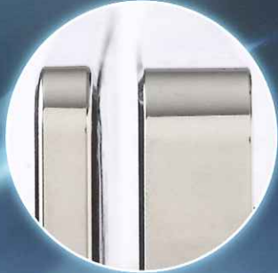
飾り枠装着時の比較