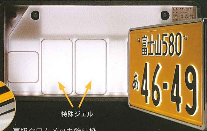
高級クロムメッキ飾り枠