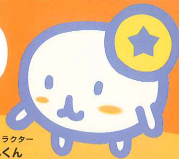
マスコットキャラクター だいまもんくん