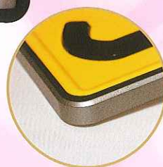
シルバーメタリック飾り枠