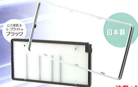
この写真は L・ブライト® ブラック

省電力・高照度・長寿命、そして低価格でご好評頂いている、 LED 字光式照明器具 L・ブライト®にメッキフレームが専用オプションとしていよいよ登場。 ハイ・コストパフォーマンスだけじゃない、 ドレッシーな輝きも次世代へ。