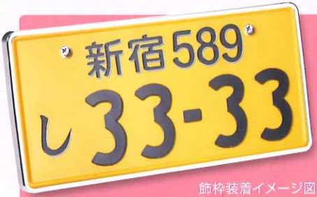
飾枠装着イメージ図